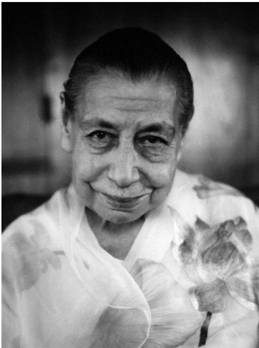
МИРРА АЛЬФАССА (МАТЬ)